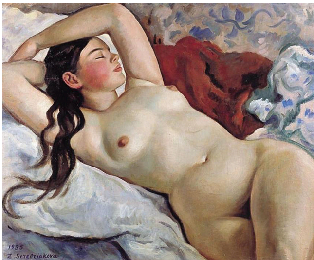
Zinaida Serebriakova, "Reclining Nude 4", 1935.