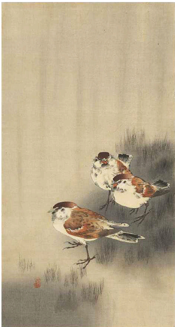
Ohara Koson, "Three tree sparrows in a rain shower".