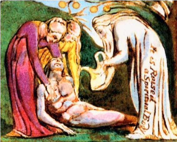
Tinsel bir Beden olarak büyütülüyor

Sıvadin dilimi de duygusuz balçıkla Ve jurnalledin beni Fani Hayata, Ben ki özgür kıldım İsa'nın Ölümüyle, Öyleyse ne yapmalı seninle şimdi?