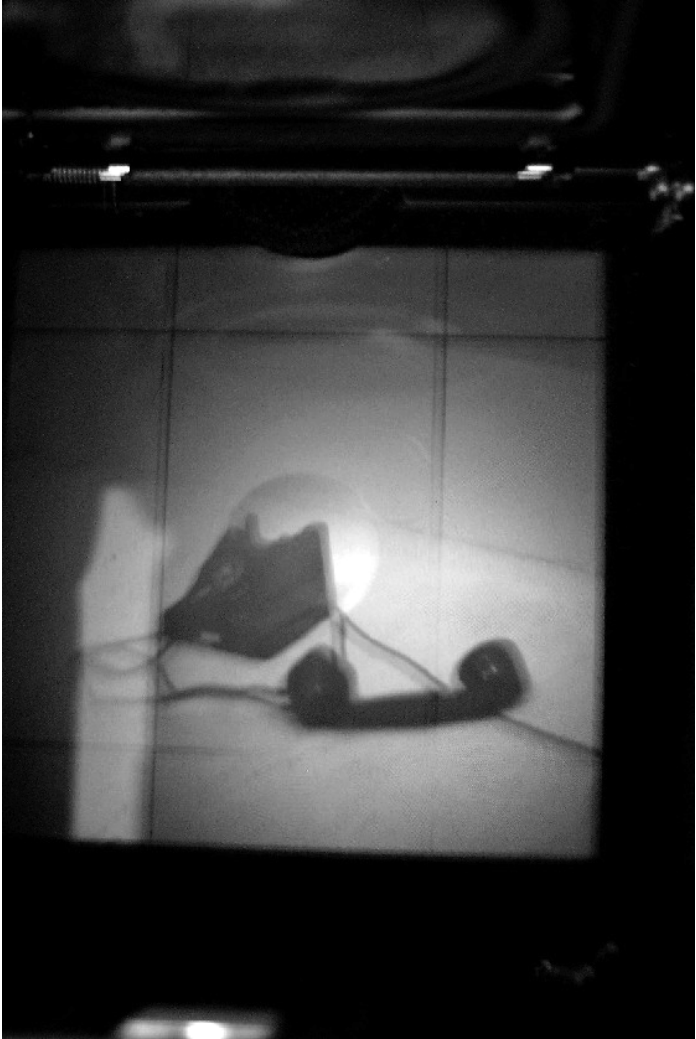
Vizörlerden Geçerek Sana Ulaşmak 4

Dedim ki, içmek ve yazmak zorundayım ve çok uykum var ve kan kaybediyorum ve bir bardak tavşankanı taze çay istiyorum. Sözcükler uçar korkusuyla sol elimin tırnaklarını geçirdi-