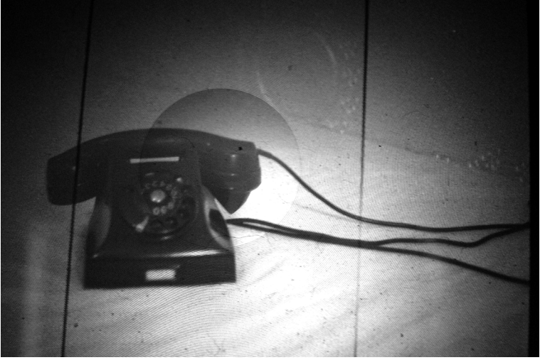
Vizörlerden Geçerek Sana Ulaşmak 2

neydi, ama bu durum beni çok mutlu etmişti. Bir sigara yak- tım ve tütürmeye başladım. İlk derin nefesle birlikte, her gün çiş kumuna bokuyla şiirler yazan Lilith'in tam bir odalık gibi sere serpe uzanarak çırılçıplak pozlar verdiği, mor üzerine kırmızı çizgili battaniesini ve birkaç yastığı kapıp geldim ve pervazı konforlu bir yatak haline getirdim. Biraz sonra, gerine esneye Lilith de geldi ve koynuma girdi. İşte yine ("olmayan hiçbir şeye tahammül edemeyen lanet tybolar "ın geri zekâlı dediği Lanet Dave ve onun Lanet Köpeği gibi) iki kişiydik ve her kar tanesi, gözlerimizin içine baka baka, yapayalnız düşü- yordu yere. Çok geçmeden, sihirli bir ışıltının altında, evimde birlikte yaşadığım ya da henüz yaşamaya başlamadığım metal ve dilsiz masal kahramanlarımın huzurunda beyaz bir uykuya daldık. Mutlak yüceliğini ne yaparsam yapayım hissedemeye- ceğim, yalnızlığın da sevinçli ve düzenli bir sığınak olduğunu unutacağım o ikisifirsıfıryedilik sapsarı günlereyse daha çok, çok vardı. "Ah evet, Aurora'yı anımsıyorum / dizlerimin üze-