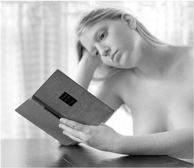
Fotograf: Al Calkins , "Of Mice And Men"